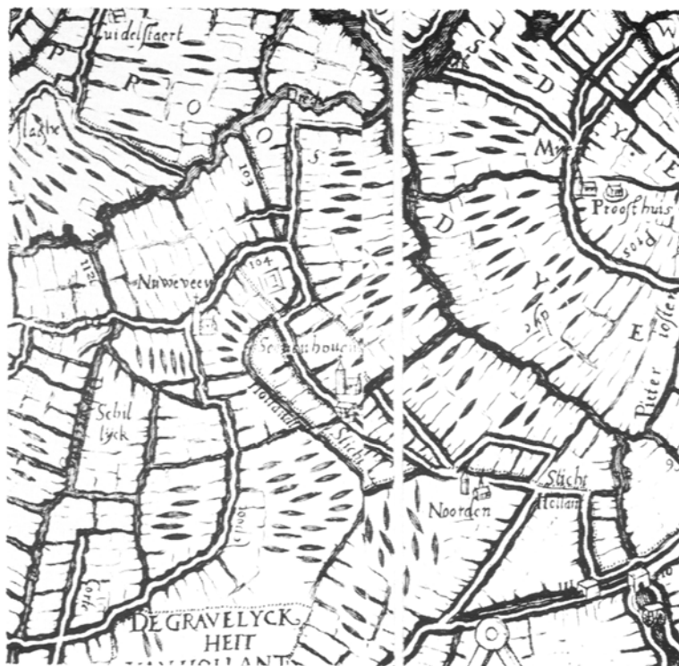
Afbeelding 1: Joost Jansz. Beeldsnijder, 1575

Het belangrijkste dat wij hieruit kunnen opsteken is dat zich tussen de beide dorpen een watertje bevond met de naam De Dobbe. Dit doorkruist de Zevenhovense dijk ongeveer op de plaats waar wij Liemeer kunnen vermoeden. Er staat echter geen naam bij. De Dobbe is thans geheel verdwenen, met uitzondering van een restant in de Buitendijkse Oosterpolder (het bovenland bij de Drecht). Bijzonder intrigerend is het wat wij zien op - de kaart van Joost Jansz. Beeldsnijder, een houtsnede uit 1575 (afb. 1). Voorbij Noordeinde (hier niet aangegeven) gaat de Zevenhovense dijk over in een pad, dat met een stippelijntje is ingetekend. Wie toch de rijweg wilde volgen, moest met een boog om een opvallend fors gebouw heen. Hierbij staat het nummer 104, dat verwijst naar de toelichting, waar we lezen: "De Heer van de