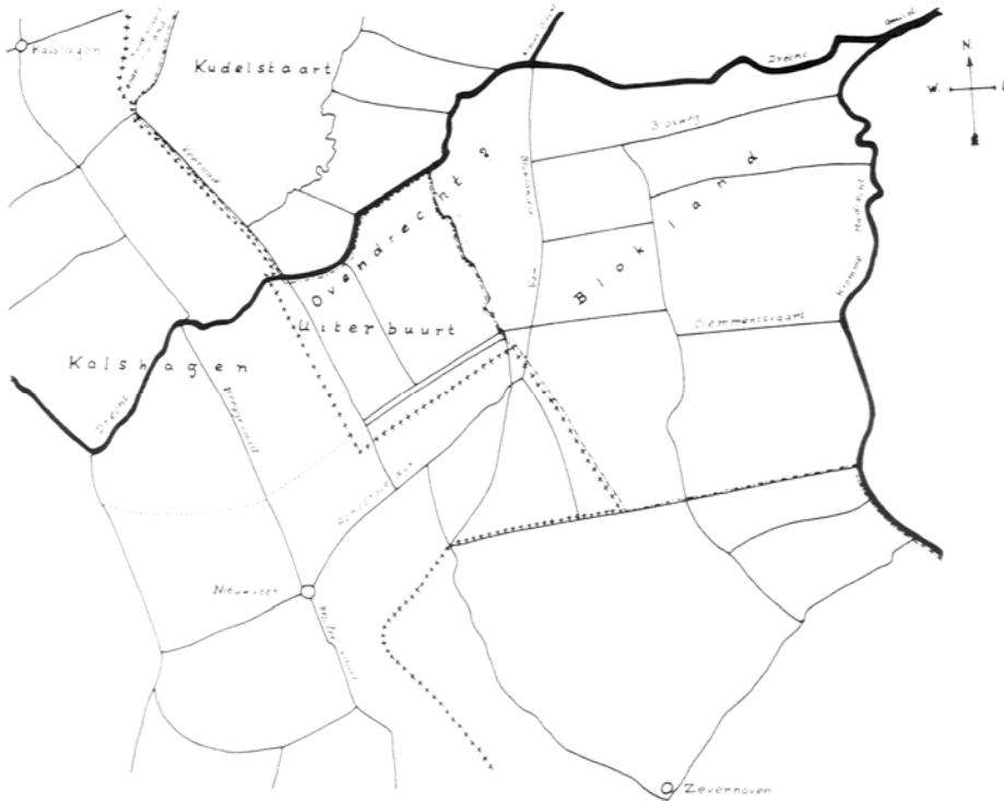
Afbeelding 4: De parochie Zevenhoven, ca. 1250 (F. Doeleman, 1982)

Het gebied van Uiterbuurt, dat ongeveer tezelfdertijd vanuit de Drecht ontgonnen werd, was duidelijk veel minder diep. Tussen deze beide gebieden ligt de Bloklandse ontginning, die eveneens minder diep was dan die van Zevenhoven. De grens tussen Uiterbuurt en Blokland werd gevormd door de Dobbe. Pas in een later stadium kwam men toe aan de ontginning van Nieuwveen (de naam zegt het al). Tenslotte ontgon men vanuit Nieuwveen het laatste restje wildernis, dat